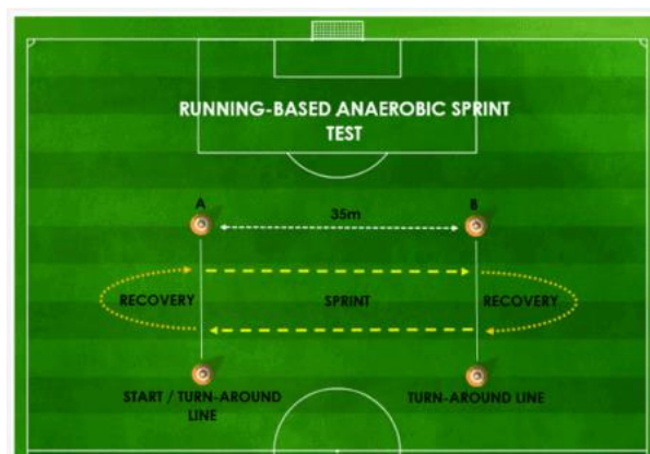
Gambar 1. Running-based Anaerobic Sprint Test

sejauh 35 m sebanyak 6 kali pengulangan atau repetisi dan jeda waktu istirahat 10 detik pada setiap repetisinya. Tes dilakukan setelah sampel selesai melakukan 45 menit babak pertama pada permainan sepak bola.