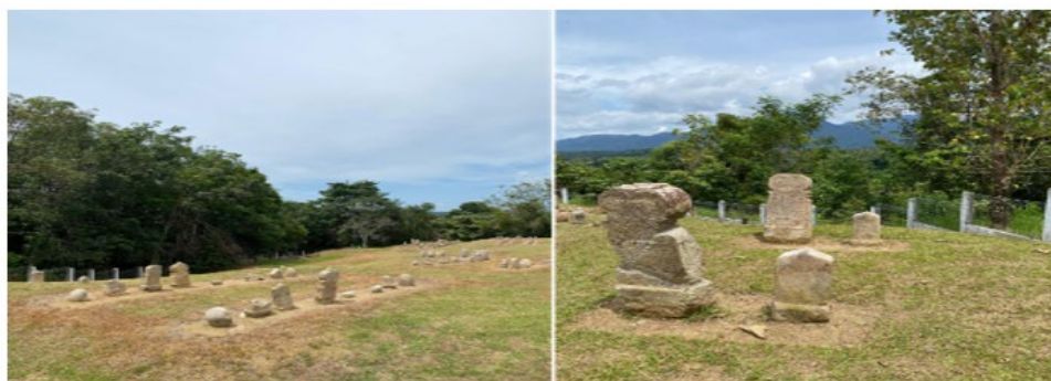
Gambar 1.2: Pada gambar ini merupakan makam yang berdasarkan wawancara Yang kami dapatkan