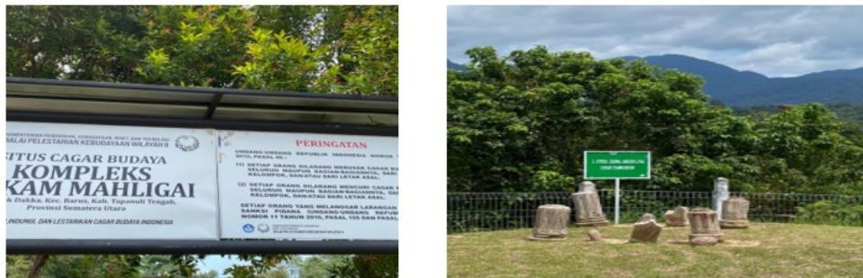
Gambar 1.1: Pada gambar ini merupakan papan informasi makam mahligai

Di beberapa daerah, seperti Aceh dan Minangkabau, makam dihiasi ukiran geometris dan kaligrafi Arab Melayu. Hal ini menggambarkan pertemuan nilai keindahan, spiritualitas, dan status sosial. Semakin megah makam, semakin tinggi pula posisi sosial atau pengaruh spiritual almarhum di masyarakat. Selain itu, penggunaan batu alam atau marmer menandakan ketahanan spiritual. Konsep Mahligai dalam konteks ini menandakan penghormatan terakhir yang agung terhadap mereka yang berjasa, baik dalam bidang keagamaan maupun sosial.