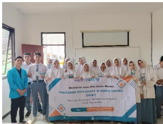
Gambar 2. Peserta Pelatihan