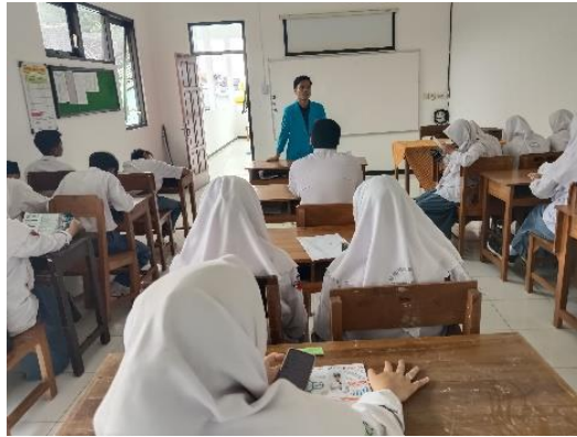
Gambar 1. Sesi Pelatihan