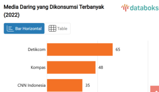
Gambar 1. Media Daring yang Dikonsumsi Terbanyak (2022)

Media, dalam hal ini Detik.com, memiliki peran penting dalam membentuk wacana social seputar kasus tersebut. Melalui pilihan kata, struktur narasi, dan representasi social, baik korban, pelaku, maupun institusi seperti media dapat menegosiasikan makna kekuasaan, tanggung jawab, dan keadilan. Sebagai contoh, Detik menyoroti identitas korban sebagai “mahasiswi” dan status pelaku sebagai “guru besar”, menegaskan ketimpangan hierarkis dalam lingkungan akademik. Selain itu, liputan mengenai aksi mahasiswa yang menggeruduk rektorat menunjukkan betapa pemberitaan ini menjadi medan perjuangan simbolik antara tuntutan moral mahasiswa dan legitimasi institusi kampus.