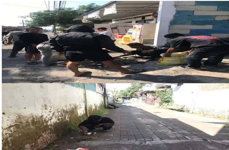
Gambar 1 Kerja Bakti Bersama

tidak berfungsi. Pada akhirnya planning yang diputuskan bersama untuk menjalankan pengerjaan hal tersebut dengan upaya agar fasilitas layak digunakan kembali, walau belum sepenuhnya sesuai dengan ekspektasi dan kenyamanan masyarakat setempat.